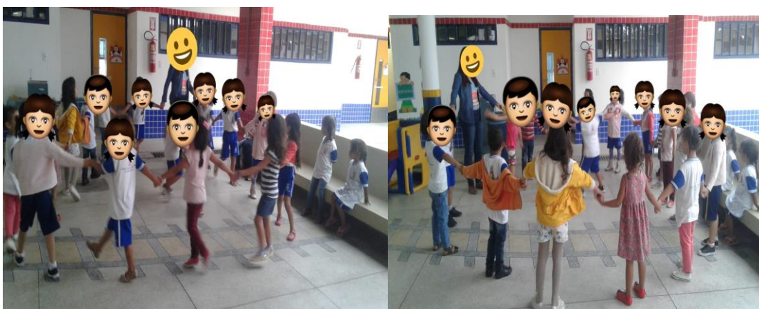
(Figura 5: Brincadeira cirandinha)

Logo depois fez um círculo com todas as crianças e realizou a brincadeira popular cantiga de roda ciranda-cirandinha . Escolheu algumas crianças aleatoriamente e pediu para que entrasse na roda e escolhesse um amigo da sala para abraçar. A professora realizou a cantiga de roda por cerca de 10 minutos. Em seguida, deu início a última brincadeira popular do dia. A seguir os registros fotográficos da ciranda-cirandinha :