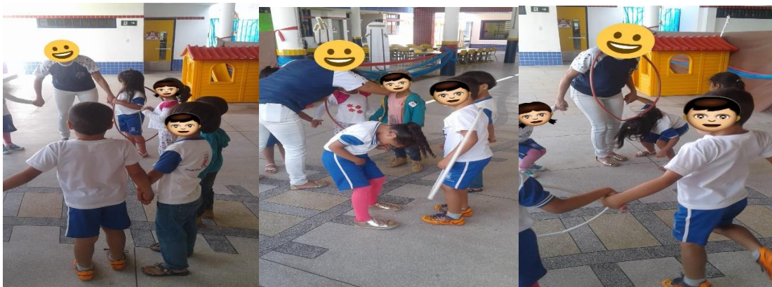
(Figura 1: Brincadeira do bambolê)

Durante a primeira observação após a docente conhecer o projeto citado anteriormente, vimos suas ações mudarem, pois durante o recreio deste dia ela realizou uma brincadeira utilizando bambolê, em que todos tinham que passar o bambolê para o colega sem soltar as mãos uns dos outros, nesta brincadeira, a professora percebeu que as crianças gostaram, o sorriso estava sempre estampado no rosto e não queriam que a brincadeira acabasse, a seguir algumas imagens deste momento: