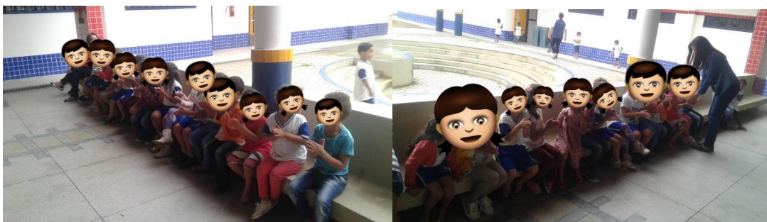
(Figura 2: Brincadeira do passa anel)

Na observação seguinte, percebemos que houve mudanças na rotina da professora, o momento após o primeiro lanche em que as crianças brincavam com peças de montar ou assistiam televisão, ela destinou a realização das atividades do tema gerador do mês citado no relato da observação anterior. Posteriormente foi o momento do recreio, ao qual as crianças brincaram livremente até a hora da merenda. Ao retornarem à sala de aula, a professora fez questão de deixar os alunos conscientes das atividades que iriam realizar e foram até o pátio. Em seguida, iniciou a realização das brincadeiras populares escolhidas por ela com base no projeto sugerido. A primeira brincadeira chama-se passa anel , ela os colocou sentados no banco do pátio e em seguida passou o anel de criança em criança e soltando-o aleatoriamente, e uma criança ficava de fora para observar seus colegas e tentar adivinhar com quem estava o anel. A brincadeira durou até todos participarem. A seguir alguns registros fotográficos deste momento: