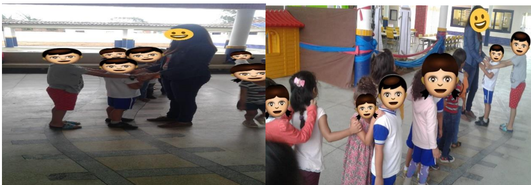
(Figura 3: Brincadeira do passarás)