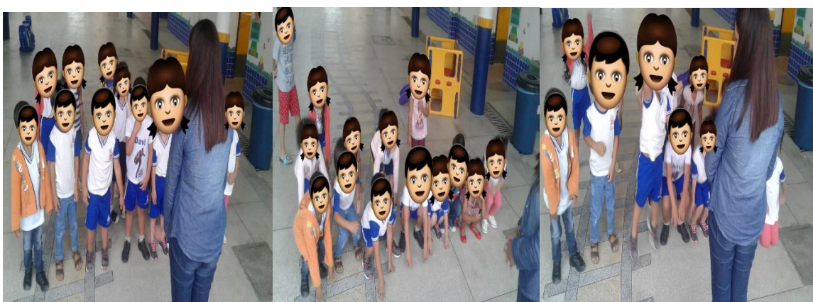
(Figura 4: Brincadeira morto-vivo)

A brincadeira do passarás ajuda na socialização e comunicação das crianças, além de estimular a criatividade. Outra brincadeira realizada pela professora chama-se morto-vivo , posicionando as crianças, em pé e de frente para ela, explicou como ocorreria a brincadeira e começou a dar os comandos vivo , morto , morto , vivo , vivo e assim sucessivamente, cada criança que errasse se retirava, a brincadeira durava até restar apenas um participante que é o ganhador. Podemos observar a realização dessa brincadeira nos registros fotográficos a seguir: