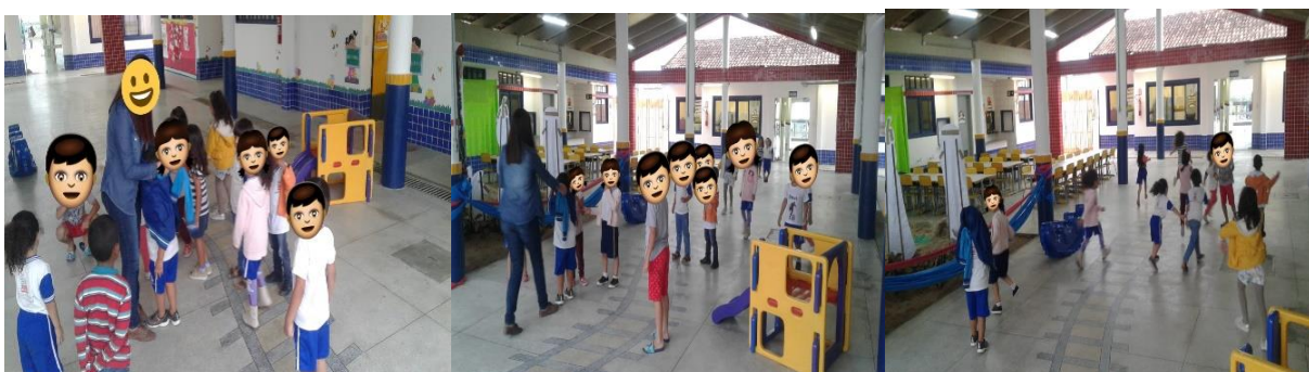
(Figura 6: Brincadeira cabra-cega)

Para finalizar a sequência de brincadeiras neste dia, a professora realizou a cabra-cega , escolheu algumas crianças e os vendou para que tentassem alcançar os colegas, como podemos observar nas próximas imagens. Todos participaram e se divertiram muito. A brincadeira foi realizada até a hora de lavar as mãos para o almoço.