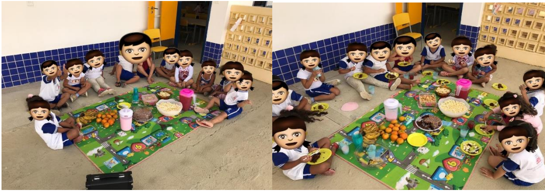
(Figura 10: Piquenique)