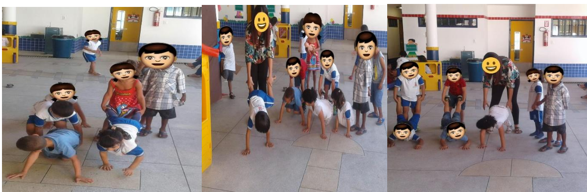
(Figura 7: Brincadeira Carrinho de mão)

No último dia de observação, novamente a professora realizou suas atividades do tema gerador do mês no primeiro horário antes do recreio, durante o recreio realizou a brincadeira popular carrinho de mão , fez a demonstração de como seria com um aluno, e em seguida formou duplas para realizarem a brincadeira, a diversão tomou conta dos alunos e dos funcionários que passavam por perto.