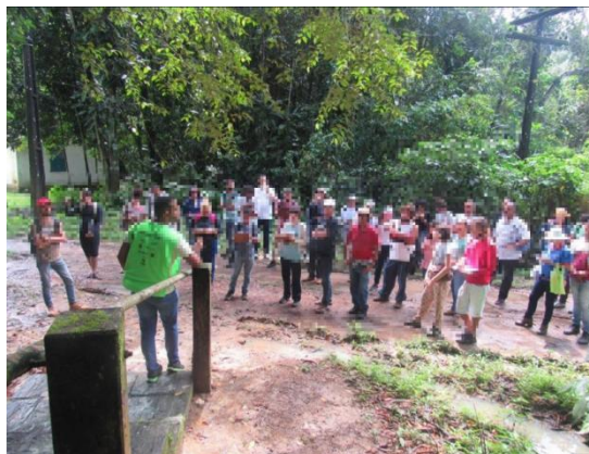
Figura 4: Reserva Ecológica de Saltinho, Zona da Mata Sul.

Encontramos ainda muitas organizações atuantes como sindicatos dos trabalhadores rurais, Federação dos Trabalhadores e Trabalhadoras Assalariados Rurais de Pernambuco - FETAEPE, Federação dos Trabalhadores Rurais, Agricultores e Agricultoras Familiares do Estado de Pernambuco- FETAPE, Serviço de Tecnologia Alternativa- SERTA, Centro de Desenvolvimento Agroecológico Sabiá, Movimento dos Trabalhadores Rurais Sem Terra - MST, Comissão Pastoral da Terra - CPT, Colônia de Pescadores. Também encontramos uma área de preservação ambiental como foi o caso da Reserva Ecológica de Saltinho (Figura 4).