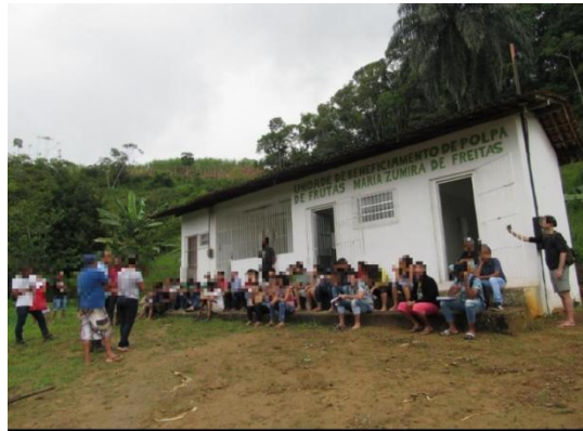
Figura 3: Unidade de beneficiamento de frutas – Sirinhaém-PE