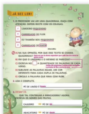
Figura 21: Seção do MP, “Já sei ler!”

memorização e com muitas repetições, a autora infere que ler tais textos é o primeiro passo para a leitura de textos mais complexos. A autora não apresenta sugestões de quais textos seriam considerados de mais fácil compreensão no Manual do Professor, porém afirma que a facilidade dos textos utilizado no LD se dá pela sua sonoridade, rima, repetição e fácil memorização, como pode ser visto na descrição feita pela autora da sessão “Já sei ler”, como pode ser visto;