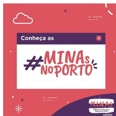
Figura 2 - Post Instagram MINAs