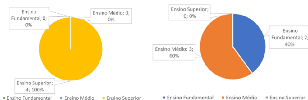
Ilustração 3 – Gráficos da formação acadêmica dos funcionários:

Nos gráficos a seguir, é possível conferir a ilustração desses dados, sendo o primeiro gráfico (da esquerda para a direita) correspondente ao grupo dos administradores e o segundo gráfico ao grupo dos educadores/cuidadores.