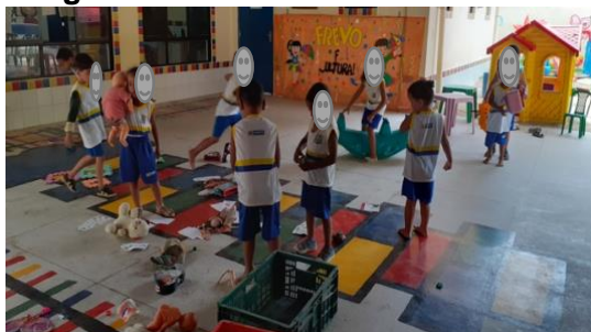
Imagem 23: Pátio/intervalo