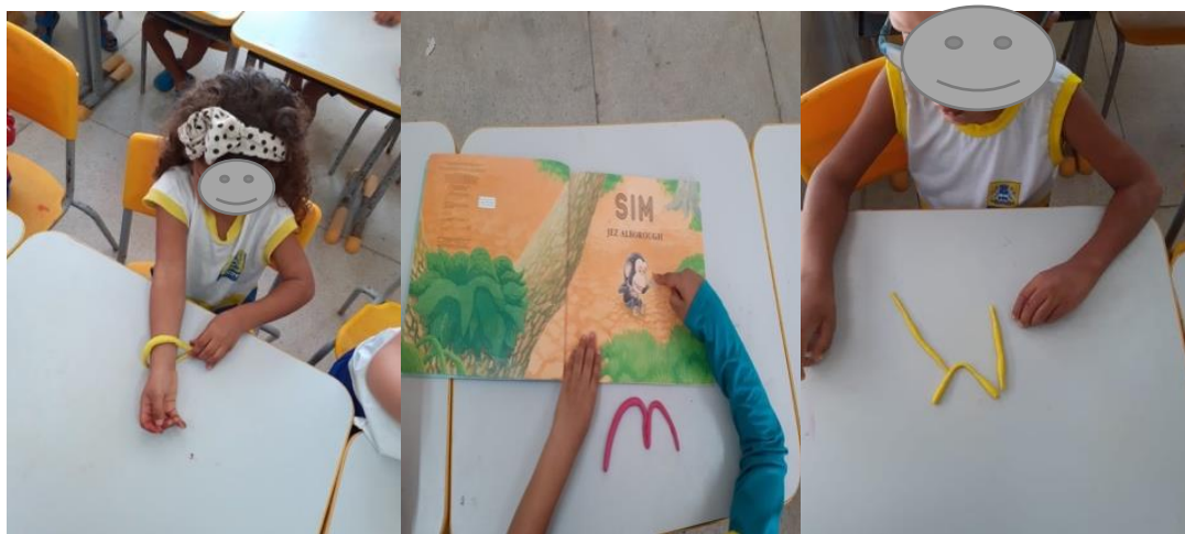
Imagem 25, 26 e 27: massa de modelar

Durante essa atividade, ao demonstrar para a criança como ela enrola a massa de modelar, fazendo movimentos de vai e vem formando uma “cobrinha”, a professora faz a criança compreender o manuseio da massa e a convida para praticá-la. Depois deste momento, as crianças tiveram tempo para realizar a brincadeira da forma como desejada. Foi possível notar que, em certas situações, estas informações transmitidas podem ajudá-las a colocar as informações que acabaram de aprender em situações imaginárias ou reais. Como podemos observar na imagem, o trabalho com massa de modelar, em que uma criança que transforma uma cobrinha em um relógio.