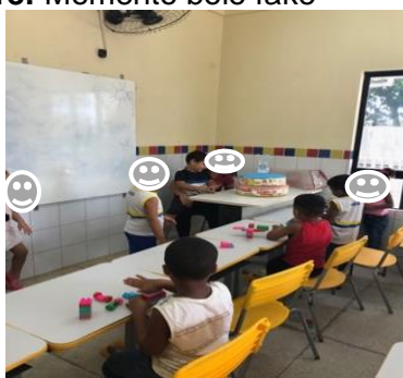
Imagem18: Momento bolo fake