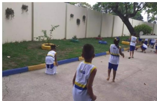
Imagem 10: Corrida de saco

Hoje nós vamos brincar de corrida no saco! As crianças riram, porém nem todos sabiam de que se referia. E a docente explicou logo a proposta e todos queriam brincar mesmo com receio. (Diário de campo, 2020).