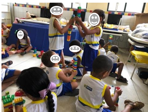
Imagem 14: Brincando com blocos