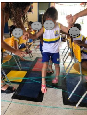
Imagem 16: Cama de gato