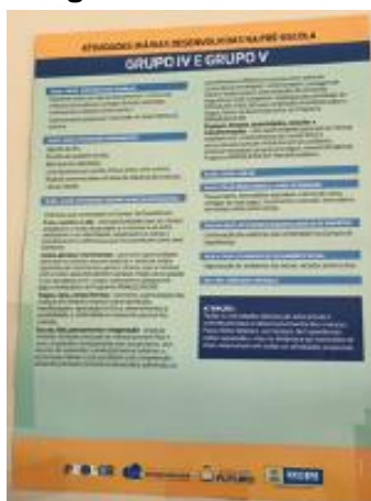
Imagem 8: Cartaz Rotina