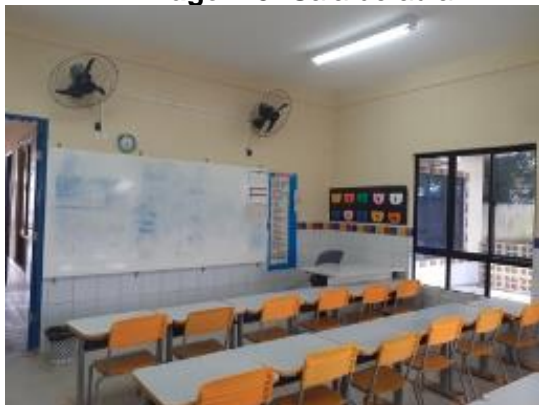
Imagem 3: Sala de aula