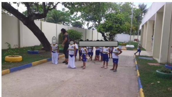
Imagem 9: Corrida de saco.

[...] é importante que o trabalho incorpore a expressividade e a mobilidade próprias às crianças. Assim, um grupo disciplinado não é aquele em que todos se mantêm quietos e calados, mas sim um grupo em que os vários elementos se encontram envolvidos e mobilizados pelas atividades propostas (BRASIL,1998. p19).