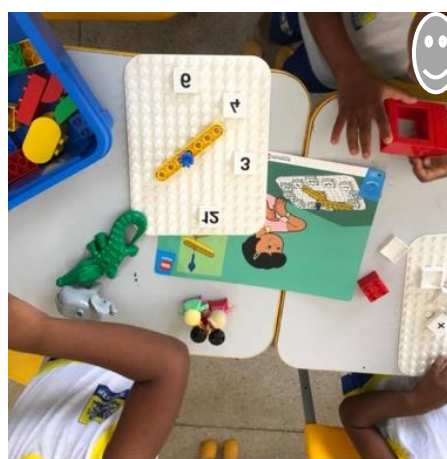
Imagem 13: Blocos LEGO