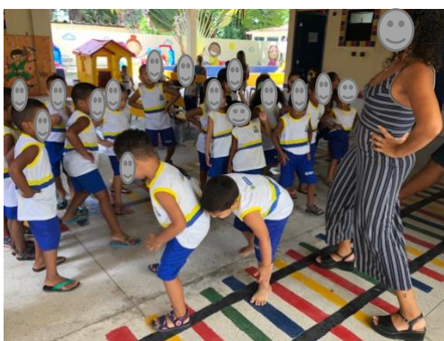
Imagem 11: Estátua

As brincadeiras de roda e a corrida de saco trabalharam a coordenação motora. Podemos assim perceber que a prática de brincadeiras que trabalham a mobilidade vem a ser enfática na prática da docente.