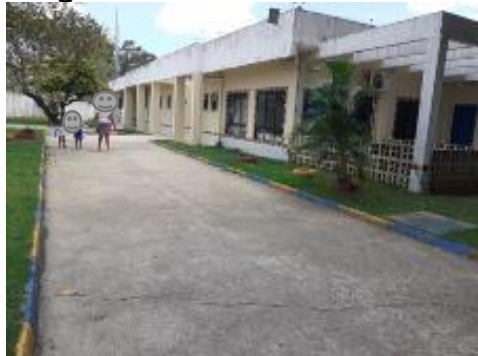
Imagem 1: Entrada