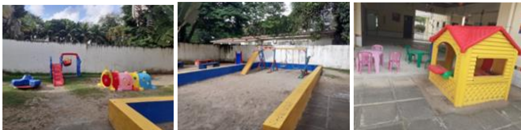
Imagem 5,6 e 7: Brinquedos do parquinho

Nota-se que as paredes da sala de aula não possuem trabalhos expostos das crianças. Vale salientar que a pesquisa foi realizada na primeira e segunda semana de funcionamento da instituição e não foi observado nesse período nenhuma atividade que constasse a produção realizada pelas crianças.