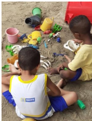
Imagem 20: Brincando