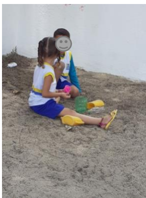
Imagem 21: Brincando