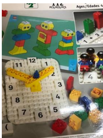
Imagem 12: Blocos LEGO

Na Educação Infantil, é importante promover experiências, nas quais as crianças possam falar e ouvir, potencializando sua participação na cultura oral, pois é na escuta de histórias, na participação em conversas, nas descrições, nas narrativas, elaboradas individualmente ou em grupo, e nas implicações com as múltiplas linguagens que a criança se constitui ativamente como sujeito singular e pertencente a um grupo social. (RECIFE, 2021, p.31).