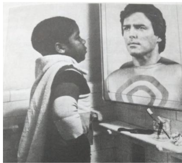
Figura 5 Campanha pelo aumento dos negros na mídia

Esse é o motivo, por exemplo, de discutirmos onde estão os negros em lugar de destaque nos quadrinhos e o porquê de somente agora com a HQ Jeremias Pele o personagem ganhar destaque. A representatividade nos quadrinhos não é um debate recente e muito menos exclusivamente do Brasil, nos anos de 1970 uma campanha veiculada pela Black-Owned Communications Alliance alertava os cidadãos americanos sobre o problema da falta de representatividade negra no universo dos super-heróis e na mídia como um todo. (BROWN apud CHINEN, 2019, p.169)