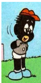
Figura 1- Jeremias em quadrinho da década de 1960 representado por meio da estética blackface.

Nesta época, os quadrinhos ainda eram produzidos com apenas duas palhetas de cor, preta e branca, e o personagem Jeremias era pintado em nanquim e ainda não tinha sua boina característica. A partir de 1961, Jeremias passou a ser desenhado dentro de um estereótipo conhecido como blackface .