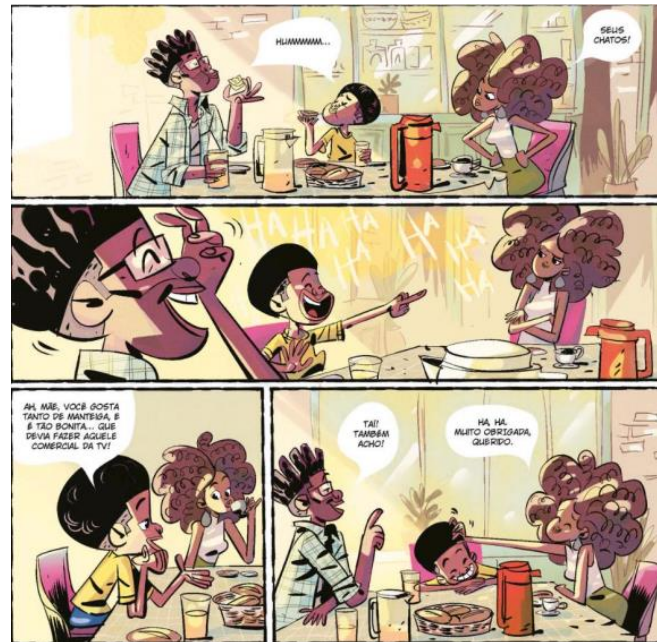
Figura 7 – Família em café da manhã feliz. (Fonte: Escaneada da revista Jeremias Pele)

então, estas palavras: “A quase-identidade do sujeito colonial com o sujeito dominante, descrito por Bhabha como “quase o mesmo, mas não é branco”. (BHABHA apud BONNICI, p.196).