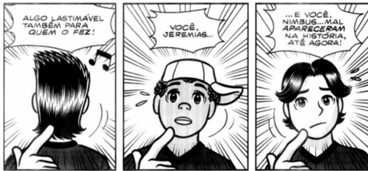
Figura 4 - Narrador brinca com a falta de relevância de Jeremias para a história da HQ Turma da Mônica Jovem N° 11.

O personagem Jeremias só será alçado ao protagonismo de fato, com uma grande história só sua, impactando o cenário dos quadrinhos com quase uma totalidade de críticas positivas, com a HQ Jeremias Pele , escrita e desenhada por Rafael Calça e Jefferson Costa e publicada pelo selo Graphic MSP.