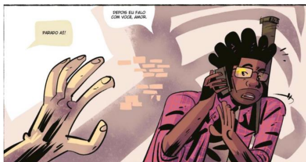
Figura 10 – O pai de Jeremias é abordado pela polícia.

Jeremias começa a perceber a visão estereotipada com a qual os negros são tratados, na escola, na sua revista em quadrinhos preferida, e isso começa a incomodá-lo até o ponto de brigar na escola. Neste momento, seu pai é chamado e mais uma vez vemos uma instituição sendo questionada pela sua conduta racista.