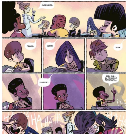
Figura 8 – a turma de Jeremias zomba de seu sonho de ser astronauta.

Jeremias, mesmo ele querendo a de Astronauta, e acaba desmerecendo o seu desejo na frente de toda a sala e causando uma situação desconfortável.