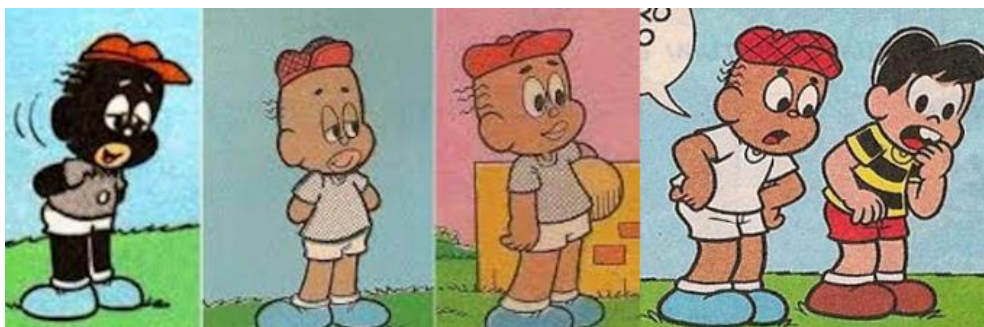
Figura 2- Evolução do personagem Jeremias ao longo dos anos.

Blackface foi um termo usado no século XIX nos Estados Unidos para retratar a técnica de maquiagem teatral na qual atores brancos se pintavam com carvão para representar personagens negros de forma exagerada e caricata. Durante muito tempo essa caracterização exagerada dos traços da negritude se repetiu de forma jocosa na TV, no teatro e nas histórias em quadrinhos, com personagens com feições exageradas e pele muito escura e lábios muito grossos, desenhados de forma arredondada.