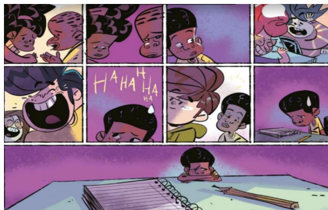
Figura 9 – Jeremias sente-se inferiorizado após sofrer preconceito.

Este é o primeiro momento em toda a história em que o personagem demonstra uma expressão de tristeza, mal-estar, o que podemos perceber, segundo Cagnin (2013), através do uso da boca fechada e curva para baixo e do arranjo dos olhos semiabertos e sobrancelhas curvas. A cor usada de fundo do quadro também muda, de amarelo é adotado um tom de violeta para ressaltar a sensação de desconforto do personagem. Esse tom passa a ser adotado em vários quadros durante a narrativa para demonstrar os momentos de conflito e apatia do personagem. De acordo com Heller (2014) a cor lilás