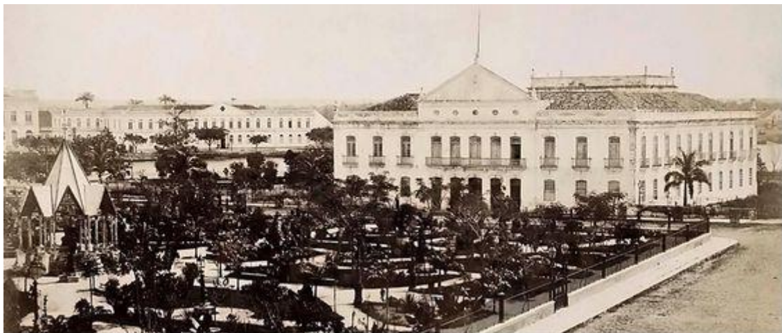
Palácio do Governo, antigo Campo do Erário, 1880.