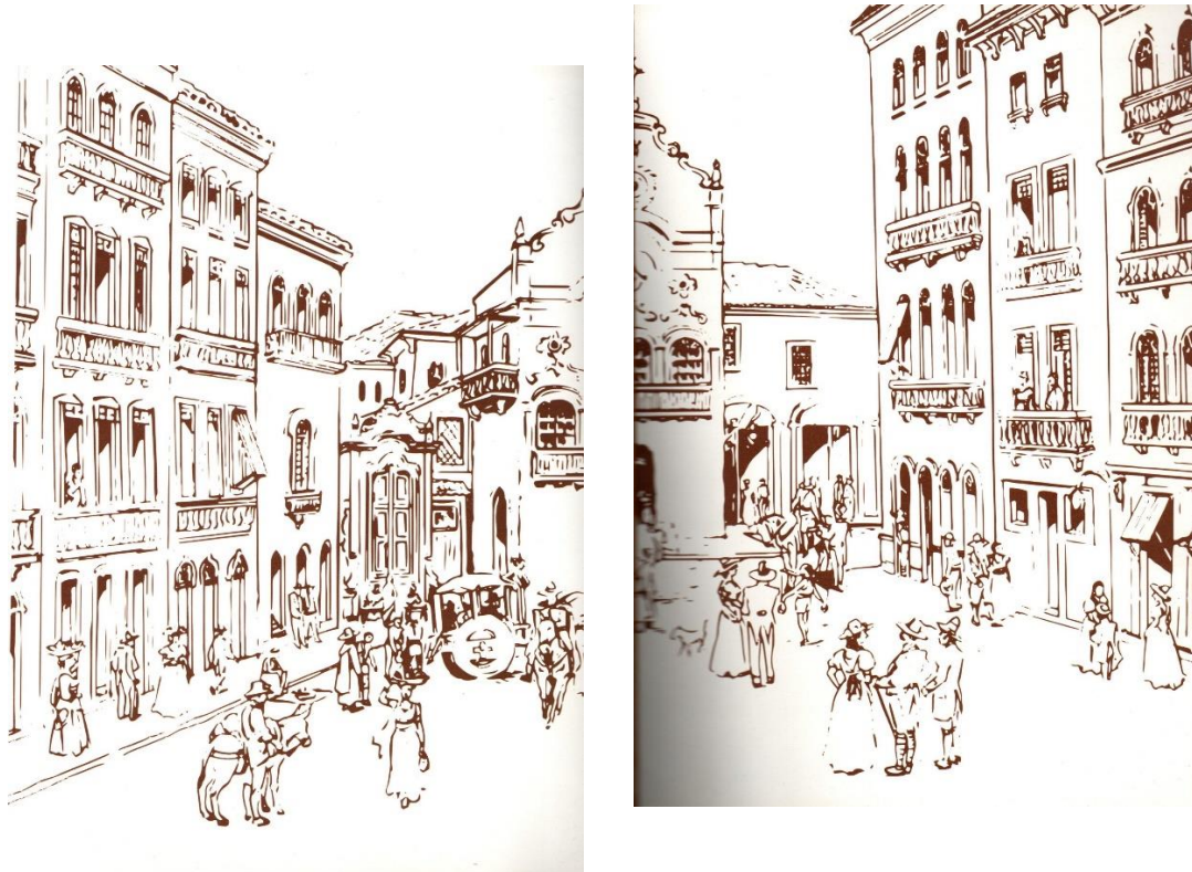
Desenho Pedro Zenival. HQ 1817: Amor e Revolução. CEPE Editora

O RPG promove acima de tudo um espaço de criação colaborativa, onde cada um, com seus personagens, molda o mundo pensado pelo mestre, além de ser moldado por ele também. Incentivando a criatividade, o companheirismo e as diversas formas de inteligência para lidar com as situações, este jogo se apresenta como o passatempo perfeito para que um grupo de pessoas possa viver de forma compartilhada as aventuras que nós só vemos em filmes e livros.