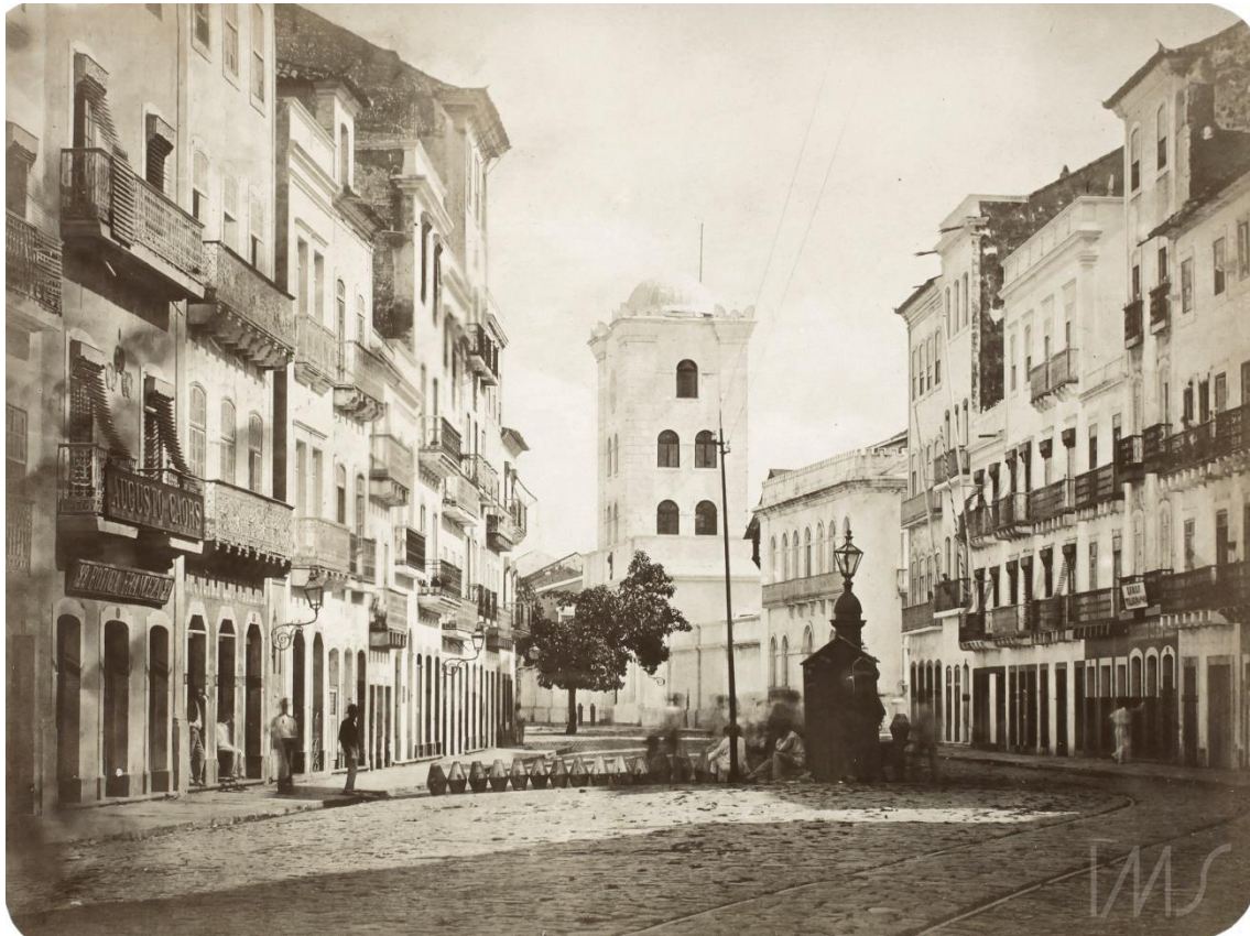
Rua do Bom Jesus – Foto de Moritz Lamberg. Acervo IMS, 1880. Disponível em: https://brasilianafotografica.bn.gov.br/?p=4622 . Acesso em: 25 nov. 2021.