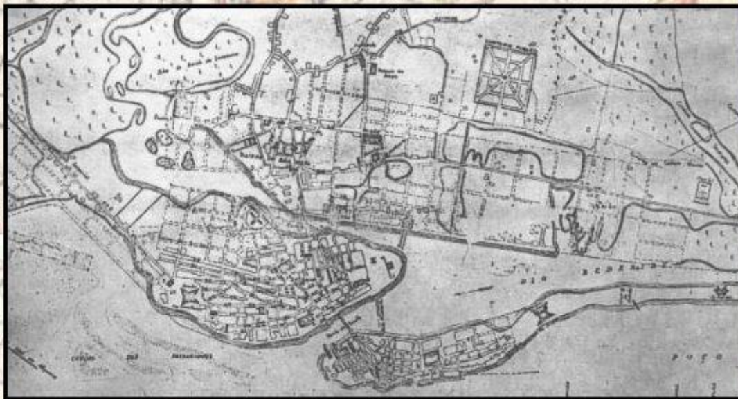
PLANTA DO RECIFE EM 1856

Plantas do Bairro do Recife, de 1856, acessadas através do portal da Prefeitura do Recife, organizado por Laura Gadelha Disponível em: http://www.recife.pe.gov.br/cidade/projetos/bairrodorecife/index.html . Acesso em: 23 nov. 2021.