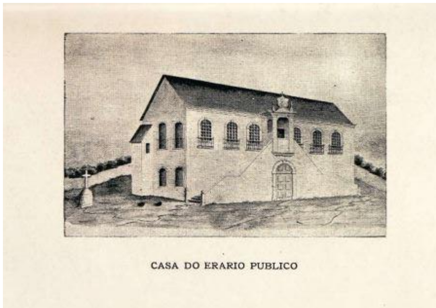
Casa do Erário – Foto de James Hendersen, 1821 In TAVARES. Francisco Muniz. História da Revolução de Pernambuco em 1817 . Recife: CEPE, 2017, pag.411