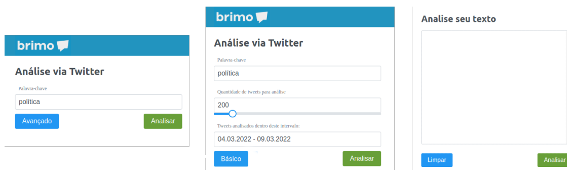
Figura 2 – Fluxos para análises

para utilizar o pacote Syuzhet para análise de sentimentos. Mais especificamente, a função que implementa o dicionário léxico de emoções NRC (National Research Council Canada), que a partir de um vetor de caracteres retorna um dataframe contendo 8 emoções ("raiva", "antecipação", "nojo", "medo", "alegria", "tristeza", "surpresa", "confiança"), bem como uma valência de positiva ou negativa.