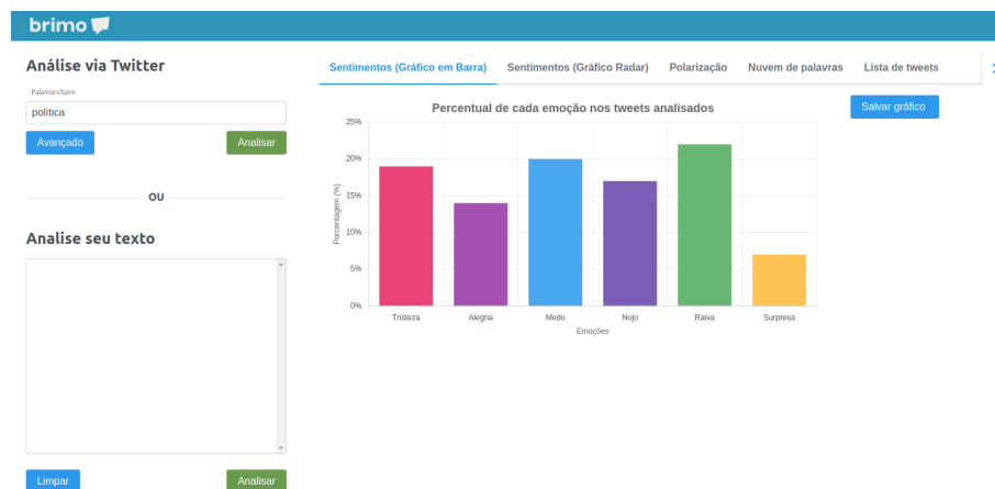
Figura 1 – Visão geral da interface da ferramenta

Existem 3 fluxos possíveis para análises na ferramenta, dois para análise via Twitter e um para análise via texto. O primeiro fluxo é a análise via Twitter no modo padrão que tem como entrada apenas a palavra-chave que será usada para busca no Twitter, como mostra a Figura 2 (à esquerda). O segundo fluxo é a análise via Twitter no modo avançado que tem como entrada 3 parâmetros: a palavra-chave, a quantidade de tweets que serão analisados e um filtro para selecionar o intervalo de dias em que esses tweets foram postados, como mostra a Figura 2 (ao centro). Por último, a análise via texto, em que o usuário pode inserir um texto de sua escolha (ver Figura 2 (à direita)) e a ferramenta retorna a análise de sentimentos do texto em questão.