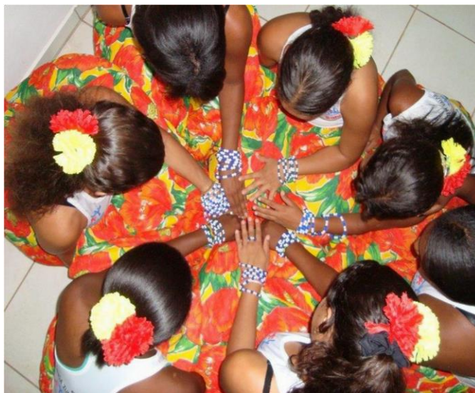
Figura 4: Parte das alunas do projeto Adote após apresentação

amostra disso está abaixo na figura (4 1 ), várias capoeiristas, depois de uma apresentação cultural: