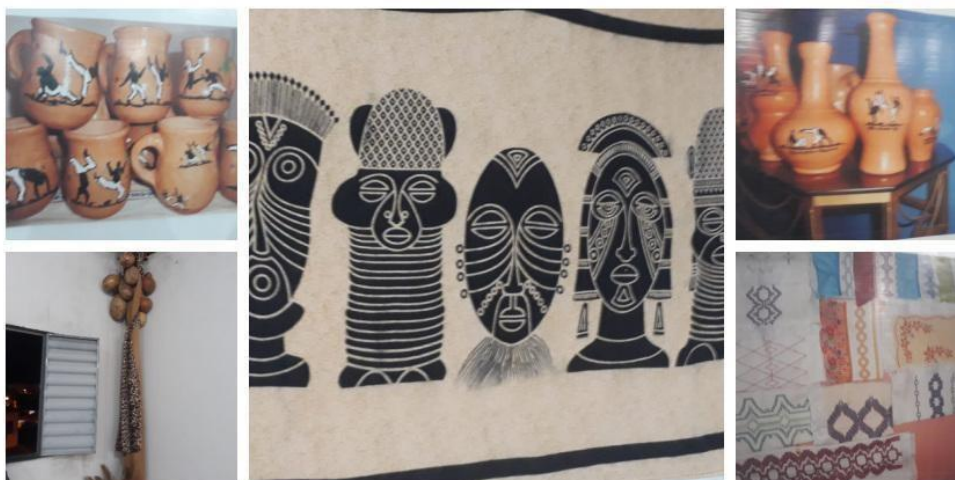
Figura 3: pinturas e artesanatos feito à mão no Projeto Escola Adote um Capoeirista.

São variadas as formas pedagógicas de se trabalhar com a arte Capoeirista nas aulas da disciplina de Artes Visuais, indo da musicalidade, pinturas, confecção de materiais artísticos, confecções de instrumentos, debates e diálogos sobre a cultura afro-brasileira. Como podemos observar na figura (3), alguns artifícios que podem ser trabalhados em aula de Artes Visuais com elementos voltados para cultura afro.