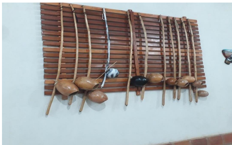
Figura 5: Berimbaus confeccionados pelo projeto Adote.

É pertinente ressaltar que a discussão sobre temas sociais é bem corriqueira no Projeto Adote, observa-se que os professores têm essa postura de conscientizar os jovens acerca de vários problemas existentes no cotidiano; drogas, violência, marginalização, racismo, etc. Nesse sentido as aulas ficam organizadas semanalmente e divididas com oficinas de capoeira regional, capoeira angola, aula teórica, oficina de instrumentos (figura 5), oficina de musicalidade, oficina de samba de roda e maculelê e oficina de artesanato. Os dois últimos acontecem a cada 2 meses, sendo intensificado perto do evento de troca de cordas que acontece uma vez no ano no mês de outubro.