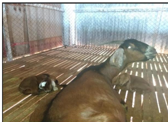
Figura 3B. Box com piso ripado, no NC do CODAI.