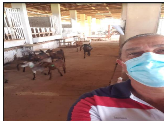
Figura 4B. Núcleo Caprinocultura do CODAI

As atividades são realizadas diariamente, a partir de observações e acompanhamento dos caprinos e ovinos (manejos diversos), nas instalações do aprisco, pois o núcleo de Caprinocultura possui um galpão utilizado para esta criação, que foi construído com material rústico (reaproveitamento de madeira de construção), alvenaria e seus complementos, tais como, telas, e reaproveitamento de chapas de metal, galvanizadas, destinadas ao abrigo e manejo dos animais.