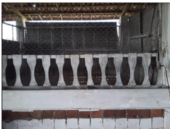
Figura 4A. Núcleo de Caprinocultura do CODAI