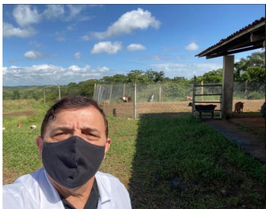
Figura 3A. Solário ao fundo, no NC do CODAI

de alvenaria na base (com aproximadamente 0,9 m de altura), chapas de alumínio, na parte traseira de cada box circundado de telas galvanizadas, nas partes traseiras e laterais. O teto do galpão é coberto com telhas de cerâmicas, com altura superior a 3,0 metros. O piso é ripado de madeira (figura 3B); existe uma área descoberta para exposição diária ao sol, pelos caprinos e ovinos, denominada de solário ao fundo (figura 3A); A figura 4A demonstra o modelo das partes frontais dos boxes, que são adaptadas para facilitar o acesso aos comedouros pelos animais e na figura 4B, observa-se a área geral do aprisco com o espaço para os diversos procedimentos.