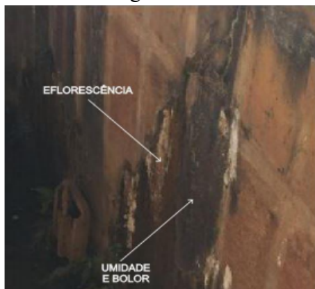
Figura 6: Carbonatação do hidróxido de cálcio localizado na superfície do tanque de tratamento de água.

De acordo com SANTANA (2017), a pressão hidrostática própria para a migração das soluções, leva o produto desta reação para a superfície formando as crostas brancas características, como pode ser observada na Figura 6. Esse mecanismo promove o aumento da porosidade, e diminui a resistência, contribuindo para o quadro de vulnerabilidade do concreto armado, inclusive à ação da carbonatação.