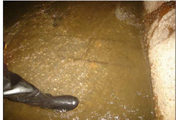
Figura 2: Desgaste superficial por erosão.

e degradante descamação da superfície do concreto, devido a pressão da água, como ilustra a Figura 2.