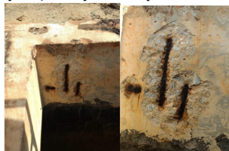
Figura 7: Corrosão da armadura em tanque de aplicação de produtos químicos.

Como uma das problemáticas mais encontradas e discutidas no que diz respeito às estruturas de concreto armado, entende-se que diversos fatores atuam como agentes colaboradores para o surgimento do processo de corrosão das armaduras, como demonstra LOPES (2018) na Figura 7.