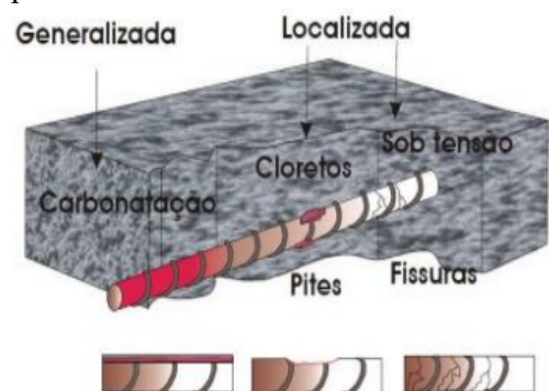
Figura 7: Demonstração de alguns tipos de ataque corrosivo

O ataque corrosivo evolui e, agravando-se, pode gerar tamanha perda de seção que ocasiona a perfuração e ruptura da barra. Enquanto que a corrosão sob tensão, apesar de também ter como característica o processo deletério localizado, é derivada de uma excessiva tensão de tração na armadura, resultando na propagação de fissuras na barra de aço (COSTA E SILVA, 2020).