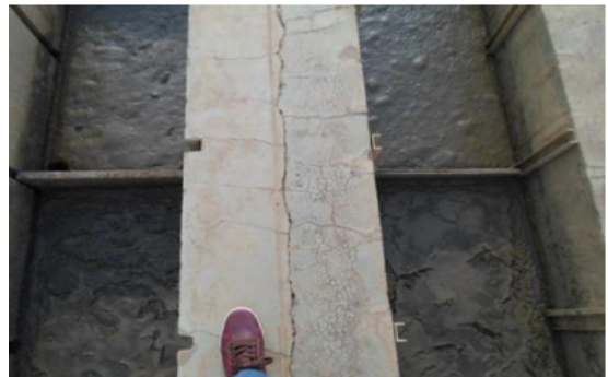
Figura 4: Fissuras no tanque de desinfecção

A figura 4 mostra uma fissura no tanque de desinfecção, observada no trabalho de Avelar e Saturnino (2020). A presença desse sintoma, permite a fácil penetração de agentes agressivos ao substrato do concreto, tornando a estrutura ainda mais vulnerável à condição exposta.