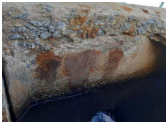
Figura 3: Estágio avançado de desgaste do concreto no tanque de armazenamento.

Em seguida, a Figura 3 apresenta o segundo estágio, quando os impactos das partículas sólidas transportadas juntamente com a água provocam a desintegração da argamassa e, subsequentemente, a exposição dos agregados graúdos. Nessa fase é possível notar de forma evidente a degradação do concreto nos tanques, de forma não mais superficial, acrescentando a gravidade (SOUZA, 2020).