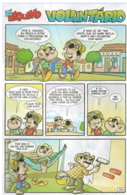
Figura 1 - História em Quadrinhos Fonte: COSTA, MARCHETTI e SOARES (2015) - Para Viver Juntos Português. 4. ed. Pág.86

Destacamos algumas atividades com HQ encontradas no LD: