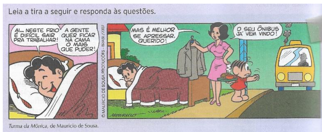
Figura 6 - Tira Mônica

Imagens ajudam a aprendizagem, quer seja como recurso para prender a atenção dos alunos, quer seja como portador de informação complementar ao texto verbal. Da ilustração de histórias infantis ao diagrama científico, os textos visuais, na era de avanços tecnológicos como a que vivemos, nos cercam em todos os contextos sociais. (DIONÍSIO, 2006, p.141).