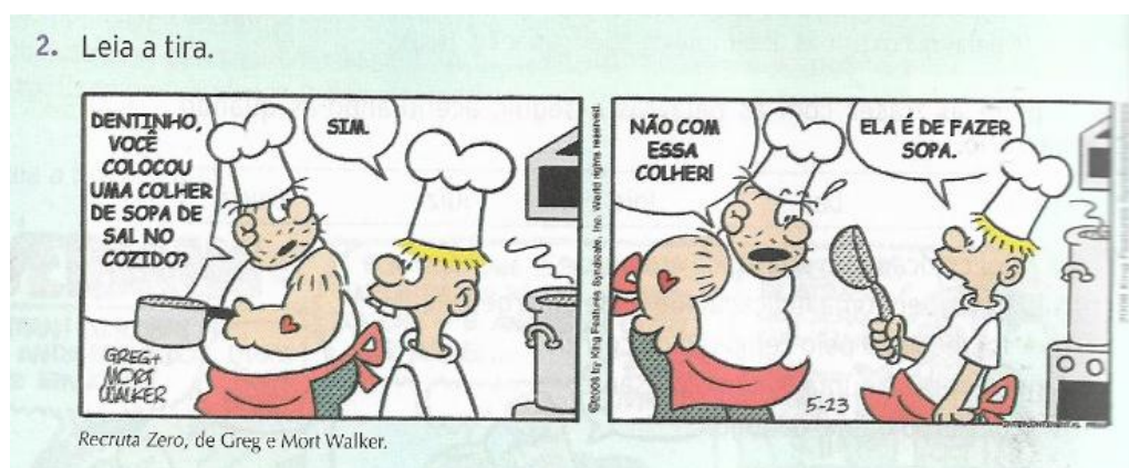
Figura 8 - Tira Zero Fonte: COSTA, MARCHETTI e SOARES (2015) - Para Viver Juntos Português. 4. ed. Pág.218

Na figura 8, percebemos que o aspecto visual utilizado nas tirinhas tenta aproximar o leitor utilizando uma linguagem mais casual, que se aproxima da fala, e consequentemente facilita seu entendimento sobre o que está sendo abordado no texto. O texto dessa maneira rompe os paradigmas mais formais por uma leitura mais leve e prazerosa, com um leve toque de humor.