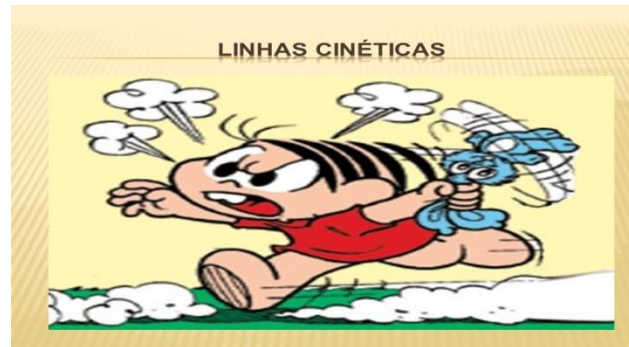
Figura 8: Exemplo de Figuras Cinéticas

sai do lugar, que no caso podem ser objetos ou corpos que estão nos quadrinhos desenhados no papel. A figura 8 mostra bem as figuras cinéticas: