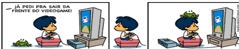
Figura 2: Exemplo de linguagem verbal e linguagem visual