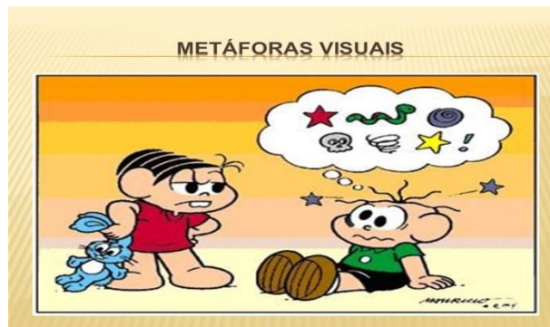
Figura 7: Exemplo de Metáfora Visual