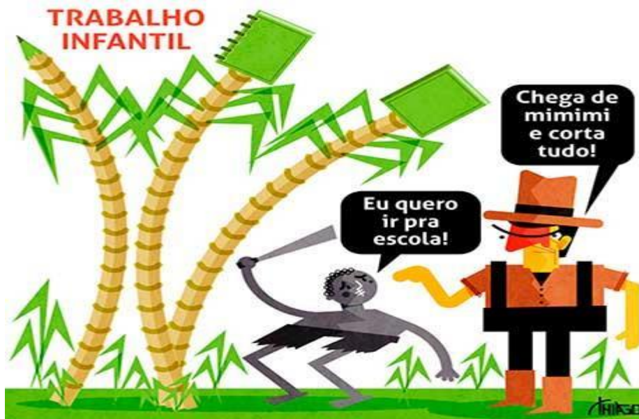
Figura 11: exemplo de charge verbal