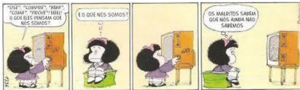
Figura 9: Exemplo de tirinha

Na figura 9, podemos visualizar um exemplo de tirinha: