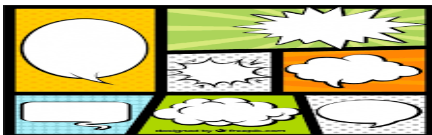
4: Exemplo de Balões