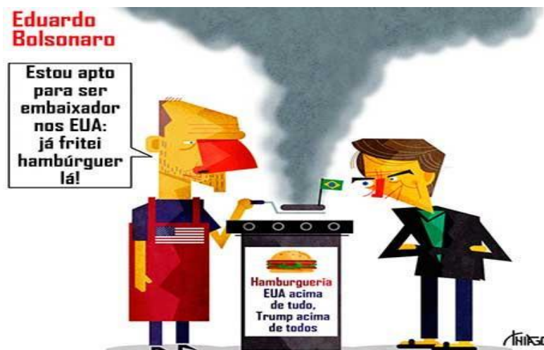
Figura 10: Exemplo de charge