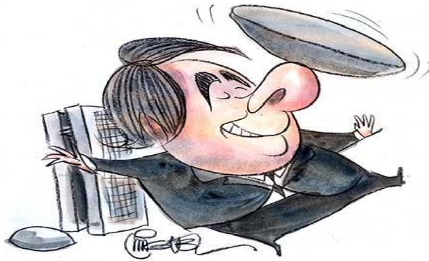
Figura 12: Exemplo de charge não-verbal.