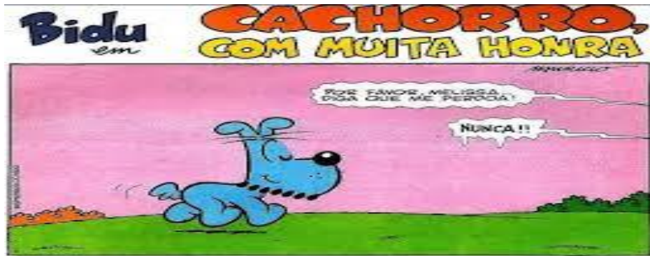
Figura 3: Exemplo de Legenda