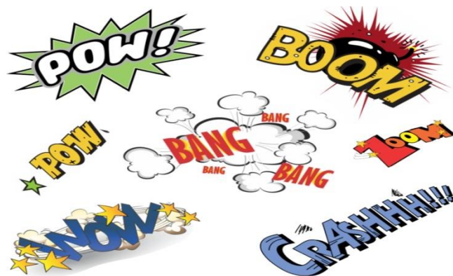
Figura 6: Exemplo de Onomatopeia