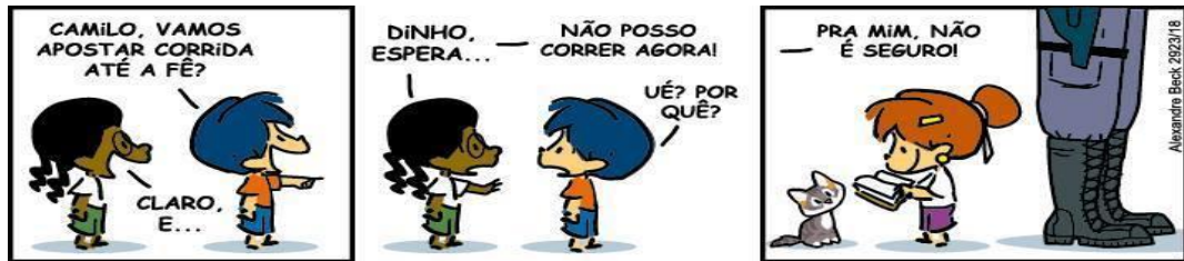
Figura 5: Exemplos de personagens

Os personagens são os sujeitos da ação. É sobre eles que a narrativa é construída. Vergueiro (2009, p. 52) diz que, “a representação dos personagens – da figura humana, enfim -, vai obedecer ao estilo dos quadrinhos”. Como mostra a figura 5: